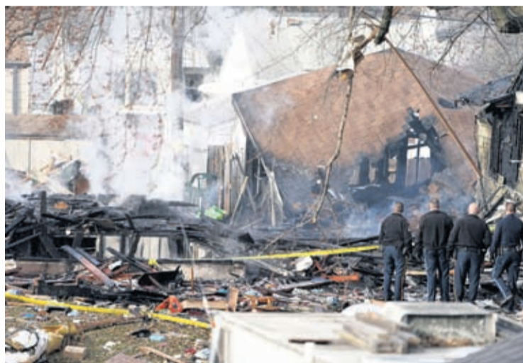
(AP) — An explosion that leveled a home in Omaha killed one person and left two others critically injured Tuesday morning, fire officials said.

Omaha Fire Department Battalion Chief Scott Fitzpatrick said firefighters who responded to the explosion shortly after 8 a.m. found one person dead. Two other people were rushed to a hos-